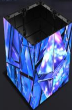
90° & cubic (Min: 250x250mm)