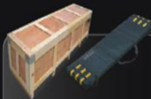
Nylon bag + Plywood case

1 iPoster in one Nylon bag 4 iPoster in one plywood case